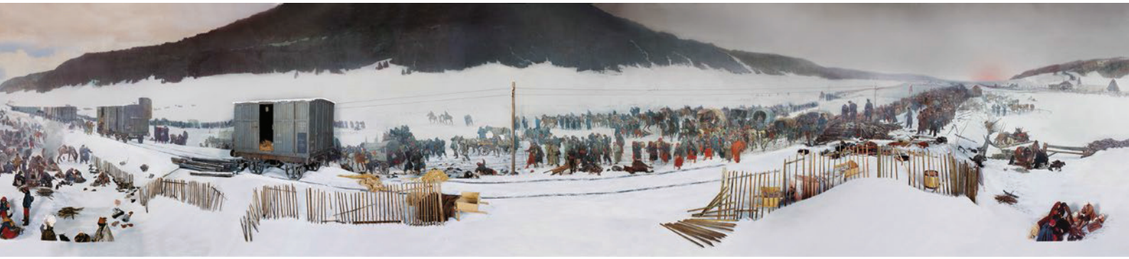
Das Luzerner Bourbaki-Panorama in seiner ganzen Pracht: Das Rundgemälde von Edouard Castres ist in natura 112 Meter lang.

gelegen, und das Bourbaki-Panorama mitten in der Stadt Luzern. Die beiden Objekte können gleich auch noch mit Superlativen aufwarten. Das 1809 bis 1814 entstandene Panorama von Thun ist das erste Rundbild der Schweiz und das älteste erhaltene Rundbild der Welt überhaupt. Und das Bourbaki-Gemälde stellt im Umfeld der Panorama-Produktion seiner Epoche ein ungewöhnliches Unikat dar: Es verherrlicht nicht militärisches Heldentum und siegreiche Schlachten, wie es in jener Zeit üblich war, sondern es thematisiert eine Niederlage – und ist eine Anklage gegen den Krieg.