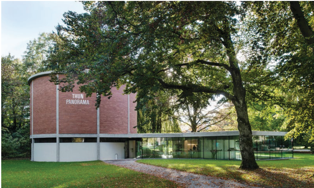
Das 7,5 Meter hohe und 38 Meter lange Panorama von Marquard Woher befindet sich in einem Park am Thunersee.